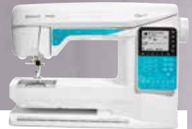
HUSQVARNA VIKING® OPAL™ 690Q