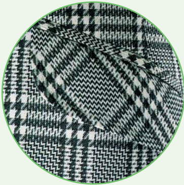
Kosi džep (PW 2045 SP)