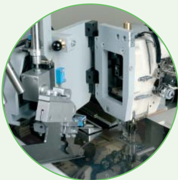
Olakšan pristup prilikom servisiranja i održavanja