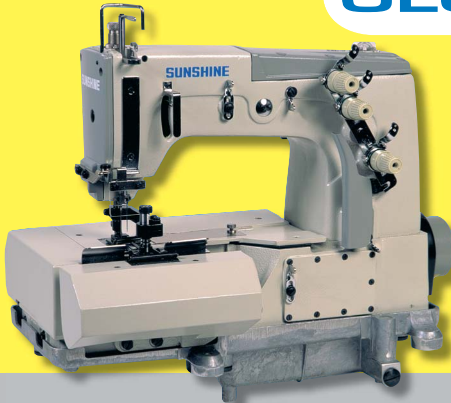
SS 1112 BLF